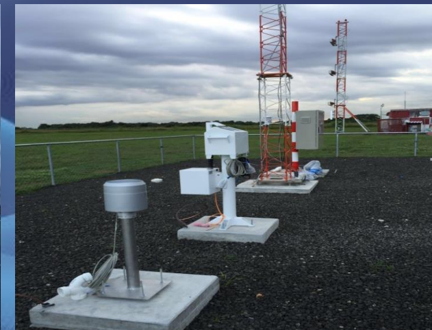
SISTEMA AUTOMÁTICO DE INFORMACIÓN METEOROLÓGICA DEL AEROPUERTO INTERNACIONAL DE TOCUMEN