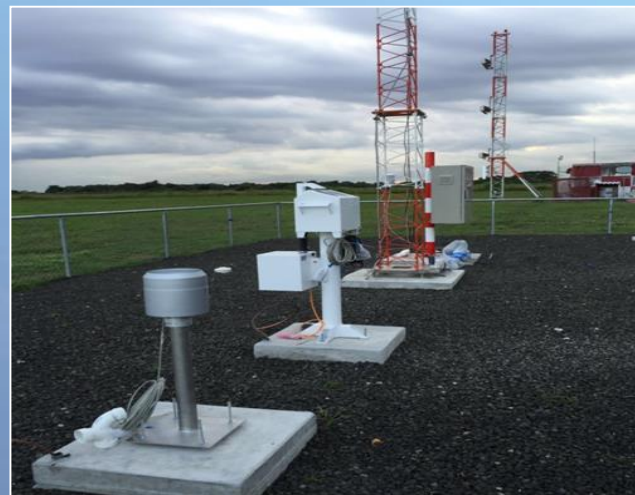
SISTEMA AUTOMÁTICO DE INFORMACIÓN METEOROLÓGICA DEL AEROPUERTO INTERNACIONAL DE TOCUMEN