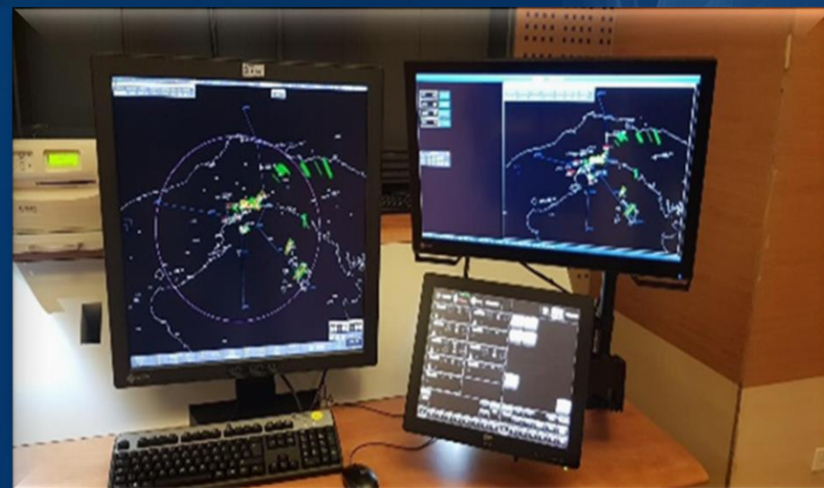
INSTALACIÓN DE SISTEMAS DE COMUNICACIONES PARA EL CENTRO DE CONTROL DE TRANSITO AÉREO